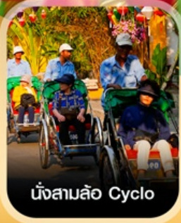
นั่งสามล้อ Cyclo