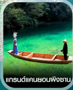
แกรนด์แคนยอนผิงชาน