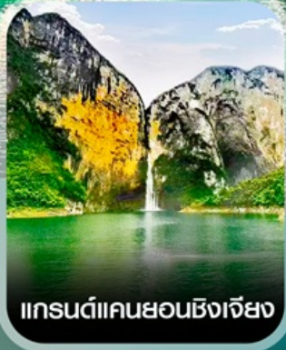
แกรนด์แคนยอนซิงเจียง