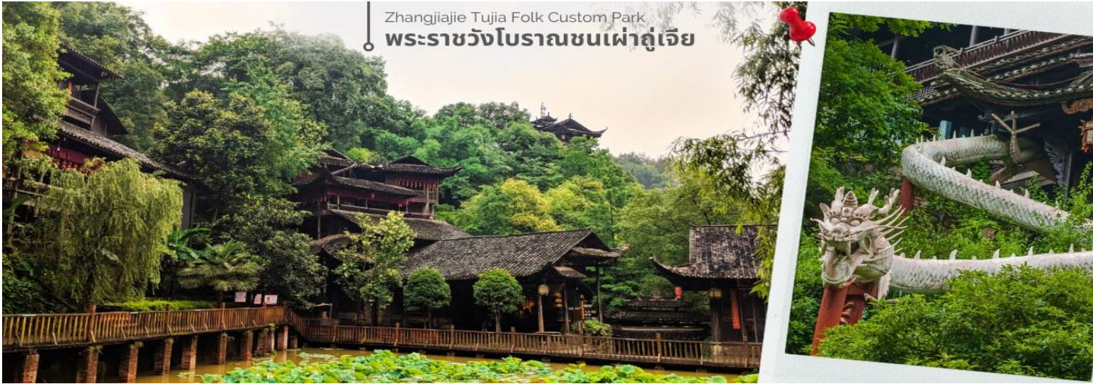
Zhangjiajie Tujia Folk Custom Park พระราชวังโบราณชนเผ่าถู่เจี๋ย

นำทุกท่านเดินทางสู่ พระราชวังโบราณของชนเผ่าถู่เจี๋ย เป็นสถานที่ท่องเที่ยวที่สำคัญในเมืองจางเจียเจี๋ย ประเทศจีน ซึ่งเป็นที่อยู่อาศัยของชนเผ่าถู่เจี๋ย. ภายในพระราชวังมีการแสดงวิถีชีวิต พิธีกรรม และวัฒนธรรมของชนเผ่าถู่เจี๋ย. นอกจากนี้ยังมีอาคาร 9 ชั้นที่สร้างจากไม้ ซึ่งเป็นที่พำนักของเจ้าเมืองในอดีต ซึ่งปัจจุบัน สามารถขึ้นไปชมได้ แต่แต่ละชั้นจะมีแสดงเสื้อผ้าของใช้ของฮ่องเต้ รวมถึงของพื้นเมืองให้เราได้ดู ด้านบนสุดเห็นวิวเมืองด้วย สวยงาม และด้านหลังยังมีอาหารใหม่ที่สร้างหลังอาคารใหญ่ๆ จะมี 2 อาคาร มีป่อน้ำตามีหลักฮวงจุ้ย