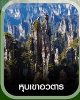
hubเขาอวตาร

ฟรี ใส่ชุดชนเผ่าท้องถิ่น บินตรงลงจางเจียเจีย