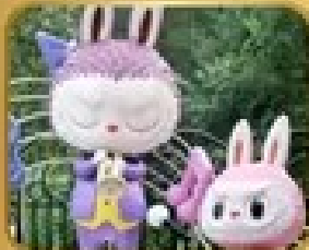
เที่ยวสวนสนุก POP LAND