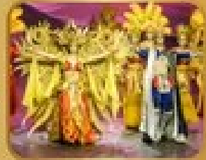
ชมการแสดงละครเวที THE GOLDEN MASK DYNASTY