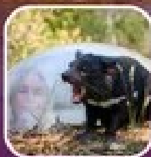
ชมสัตว์ในเขตรักษาพันธุ์สัตว์ป่า