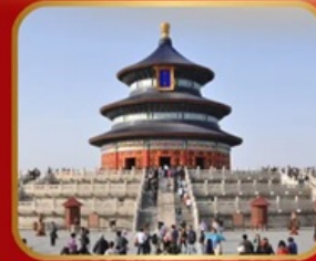
ชมความงดงาม หอฟ้าเทียนถาน