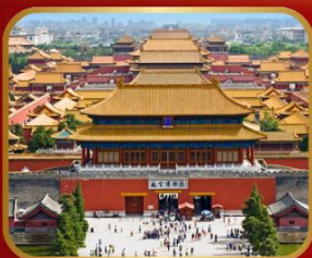
เขื่อนมรดกโลก พระราชวังกู้กง