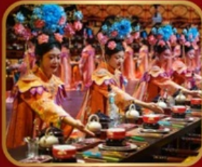
กัศดาการวังหลวง YU XIAN DU