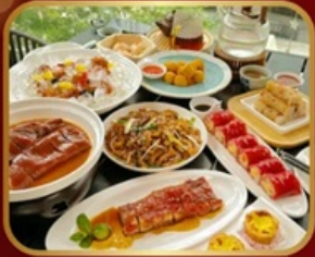
อาหารระดับ มิชลิน TAO TAO JU