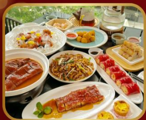
อาหารระดับ มิชลิน TAO TAO JU