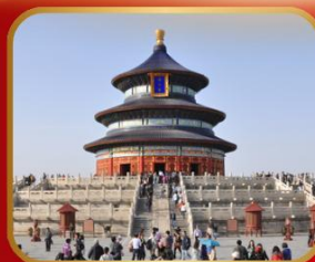
ชมความงดงาม หอฟ้าเทียนถาน