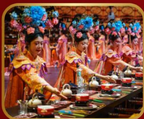
ภัตตาคารวังหลวง YU XIAN DU