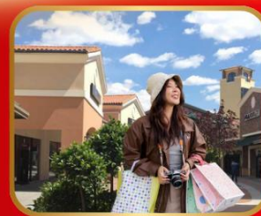
อิสระช้อปปิ้ง BEIJING OUTLET