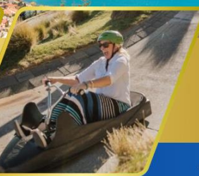
เล่นลู่ ที่ควีนส์ทาวน์

AUCKLAND / ROTORUA / CHRISTCHURCH FOX GLACIER / FRANZ JOSEF / QUEENSTOWN พักอ็อคแลนด์ 2 คืน / โรโตรัว 1 คืน / พักไครสต์เชิร์ช 2 คืน พักฟรานซ์โจเซฟ 1 คืน / ควีนส์ทาวน์ 2 คืน