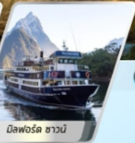
มิลฟอร์ด ซาวน์