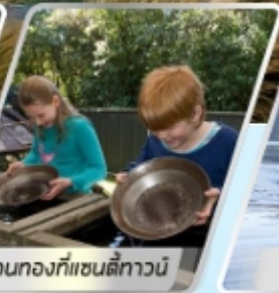
ล่องทงกที่แซนตีทาวน์