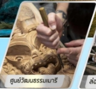
ศูนย์วัฒนธรรมเมารี