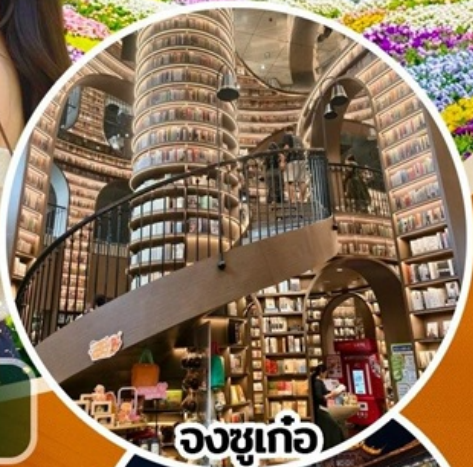
จงซูเก้อ