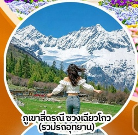
ภูเขาสี่ดรุณี ช่วงเลียวโกว (รวมปรดอุทยาน)