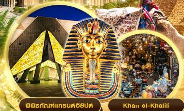
พิพิธภัณฑ์แกรนด์อียิปต์ Khan el-Khalili

เข้าชม 2 พิพิธภัณฑ์ GRAND EGYPTIAN MUSEUM & NMEC พิพิธภัณฑ์โบราณคดีใหม่และพิพิธภัณฑ์จัดแสดงมัมมี่