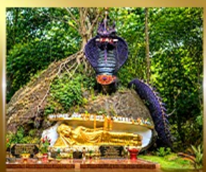
วัดตำชัยมงคล