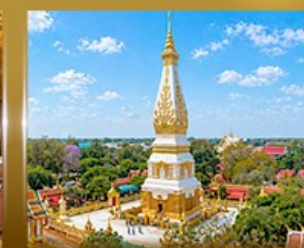
พระธาตุพนมวรวิหาร