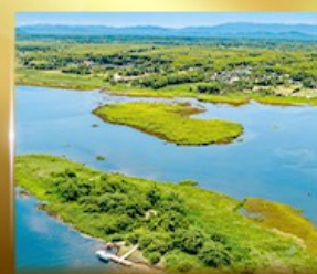
เกาะดอนโพธิ์