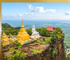
เจดีย์หลวงปู่เสาร์