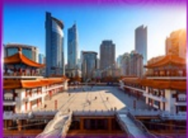
เซ็คฉิน ตึกโค่วซังโหล