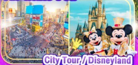
City Tour / Disneyland