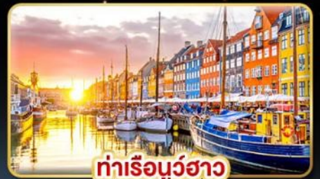
ท่าเรือบูร์ฮาว