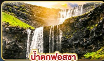
น้ำตกฟอสซา