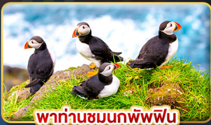
พาท่านชมนกพิฟฟิน