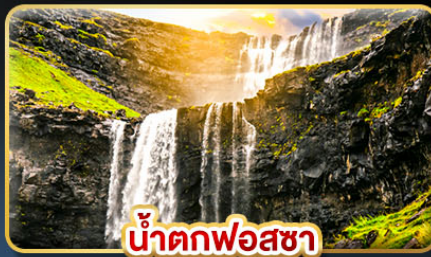
น้ำตกฟอสซา