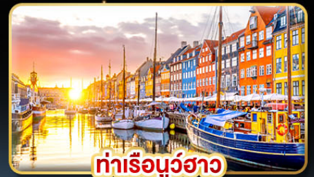
ท่าเรือนูร์ฮาว