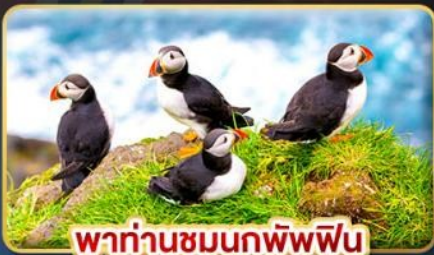
พาท่านชมนกพิพฟิน