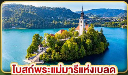
โบสถ์พระแม่มาเรียแห่งบลัด