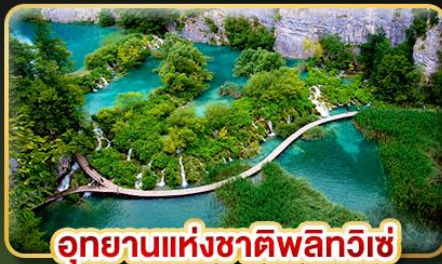
อุทยานแห่งชาติพลิวิซ