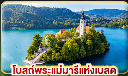
โบสถ์พระแม่มารีย์แห่งเบลด