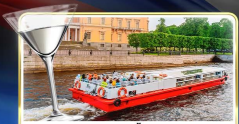
ล่องเรือแม่น้ำเนวา พร้อมลิ้ม Vodka Tasting

📅 เดินทาง : 14-21 มิ.ย.69 / 28 มิ.ย.-05 ก.ค.69 / 24-31 ก.ค.69