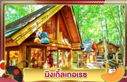
นิงเกิ้ลทอเรซ

ชมทุ่งลาเวนเดอร์ และทุ่งดอกไม้ขึ้นชื่อของฮอกไกโด ฟาร์มโทมิตะ และ ชิไก้ซโนะโอะกะ