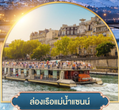
ล่องเรือแม่น้ำแซนน์