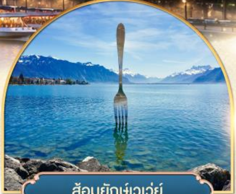
ล้อมยักเขาวัว