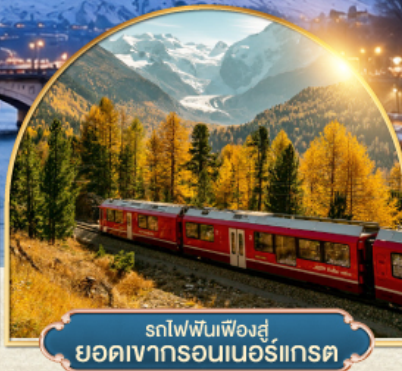
รถไฟฟันเฟืองสู่ยอดเขากรอนเนอริเกรต