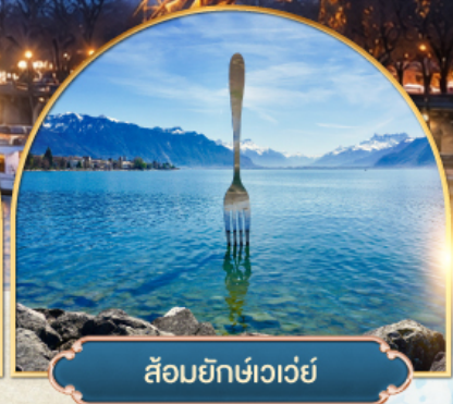
ล้อมยักซ์เวอว์