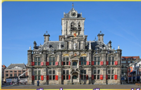
อาคารเมืองเก่าคลองเมืองเคลฟท์