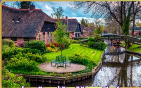
ล่องเรือหมู่บ้านไรทอนท์รูร์น