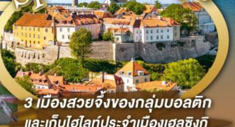
3 เมืองสวยจิ้งของกลุ่มบอลติก และเก็บไฮไลท์ประจำเมืองเฮลซิงกิ และล่องเรือเฟอร์รี่ข้ามประเทศ

ไฮไลท์ในโปรแกรม • เที่ยวสามประเทศหลักกลุ่มบอลติก • ชมเมืองหลวงวิลนิอุส ประเทศลัตเวีย