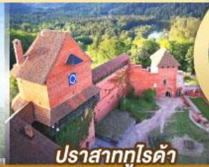
ปราสาทกูไรต้า