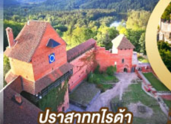
ปราสาทกูโรต้า