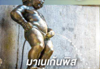
มานกันพิส