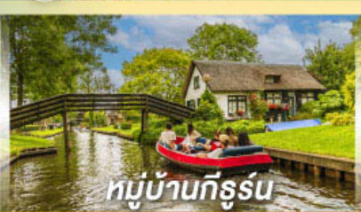
หมู่บ้านทีร์รูน