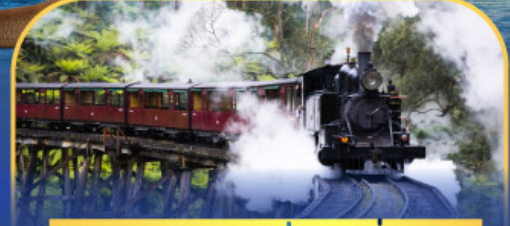
รถไฟฟั้งบิลลี่

ล่องเรือชมอ่าวซิดนีย์พร้อมรับประทานอาหารกลางวัน และ เข้าชมสวนสัตว์การองก้า