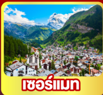
เชอร์มันเทก