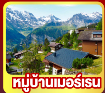
หมู่บ้านเมอร์เรน