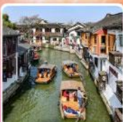
หมู่บ้านโบราณซูเจียเจี๋ย