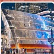
เรือหลุยส์