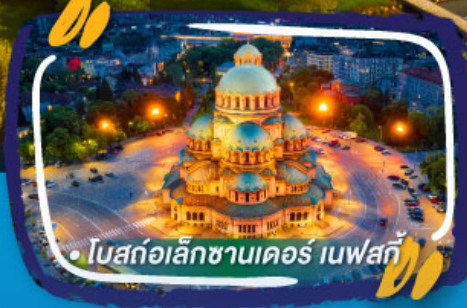
• โบสถ์อเล็กซานเดอร์ เนฟสกี