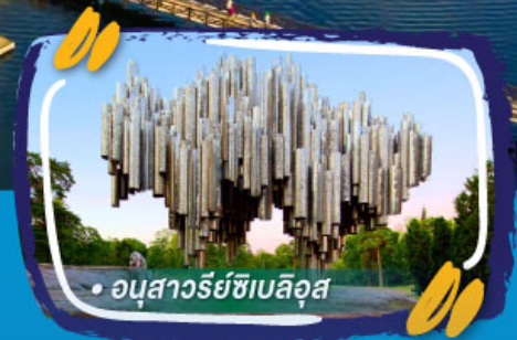
• อนุสาวรีย์ซิมบิลิส