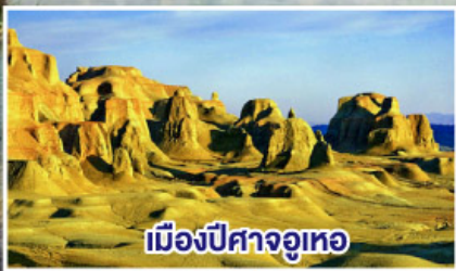
เมืองปีศาจจuteo