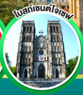
โบสถ์เซนต์โจเซฟ