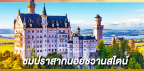
ชมปราสาทนอยชวานสไตน์