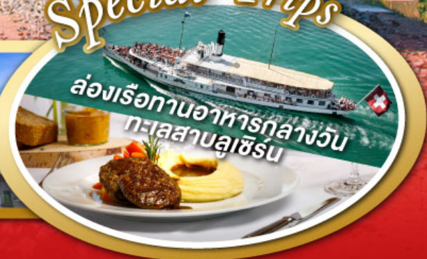
ล่องเรือทานอาหารกลางวัน ทะเลสาบลูเซิร์น