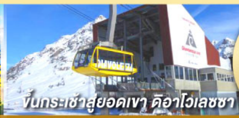
ขึ้นกระเช้าสู่ออดเขา ดือาไวเลซซา