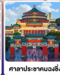
ศาลาประชาคมฉงชิ่ง