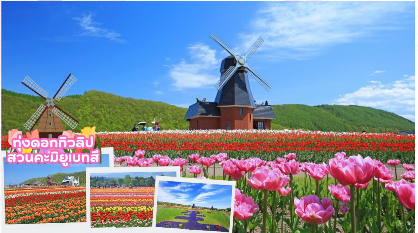
ทุ่งดอกทิวลิป สวนคะมิยูเบทสึ

จากนั้นนำท่านชมทุ่งดอกทิวลิป ณ สวนคะมิยูเบทสึ (Kamiyubetsu Tulip Park) จากสวนดอกไม้เล็ก ๆ ที่ถูกสร้างขึ้นโดยคนท้องถิ่นเพื่อสืบทอดดอกทิวลิป [ดอกไม้ประจำเมือง] ไปสู่รุ่นต่อไป และได้พัฒนา มาเป็นอุทยานทิวลิปคะมิยูเบทสึ ปัจจุบันอุทยานแห่งนี้มีดอกทิวลิปสีแสนสดใส กว่า 1,200,000 ดอก จาก กว่า 120 สายพันธุ์ ที่จะบานทั่วทั้งสวนในฤดูใบไม้ผลิ [ขึ้นอยู่กับสภาพอากาศ]