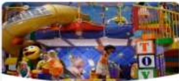
Disney's Oceaneer Club

วันนี้เรือสำราญ Disney Adventure จะล่องอยู่บนน่านน้ำสากลตลอด 2 วัน ท่านสามารถสนุกสนานพักผ่อนอยู่บนเรือสำราญที่มีกิจกรรมมากมาย ทั้ง สวนสนุกทั้ง 7 โซน ร้านอาหารธีม Disney และ Mavel ร้านขายของที่ระลึก ชมการแสดงจากหลายเวที แลพะกิจกรรมอีกมากมายทั่วทั้งเรือสำราญ