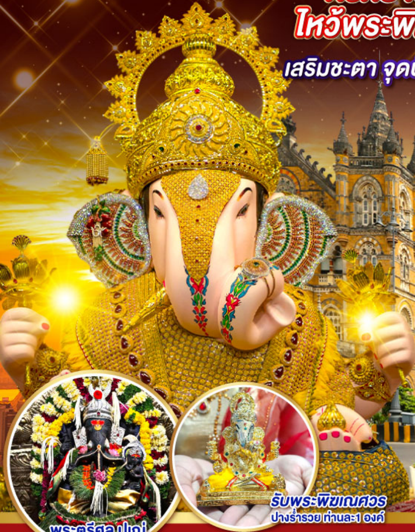
พระตรีศูล ปูणे (Trishul Pune)

เสริมชะตา จุดปัญญา มุสสุบึง มหานครมุมไบ ปูणे