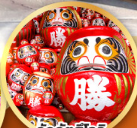
วัดคิตสึโองิ (วัดดามมะ)

ชมความงามของกำแพงหิมะ เส้นทางสายอัลไพน์ ทาคายามา (JAPAN ALPS SNOW WALL)