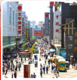
ช้อปปิ้งถนนคนเดินซุนชี่