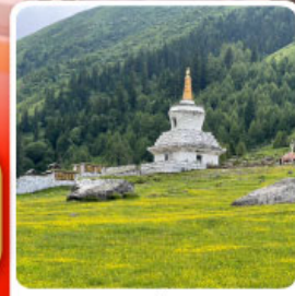
ภูเขาสี่ครุฑ