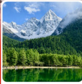
อุทยานπίงโก