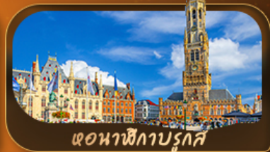
ตوناชิกาบรุกส์

เดินทาง 29 พ.ค.-05 มิ.ย. 69 / 18-25 มิ.ย. 69 23-30 ก.ค. 69 / 19-26 ก.ย. 69