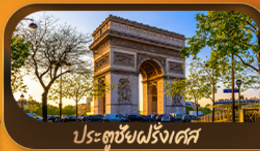
ประตูชัยฝรั่งเศส