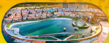
Kiss Bridge สะพานจูบ รวมค่าเข้าสะพานจูบแล้ว