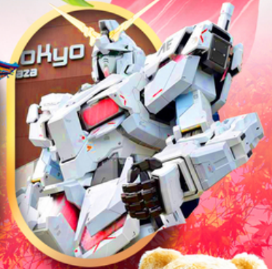
ห้างไอโดะบะกันดั้ม