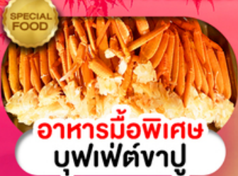
อาหารมือพิเศษ บุฟเฟ่ต์จางุ