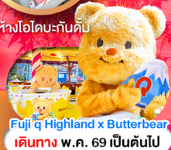
Fuji q Highland x Butterbear เดินทาง พ.ค. 69 เป็นต้นไป