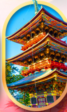
วัดนาริตะชิน