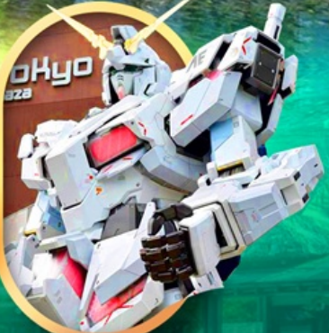
ห้างไอโดะบะกันดัม