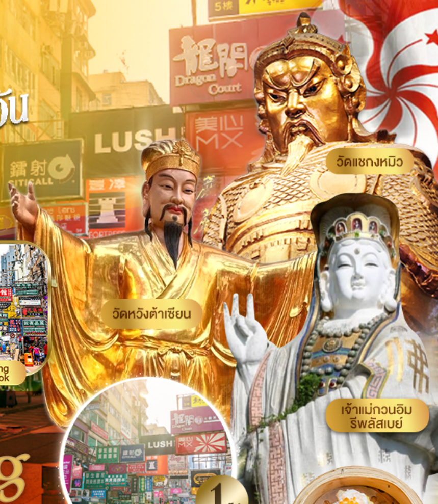
วัดเชงหมิว