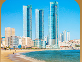
หาดแฮอินแด