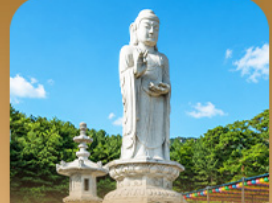
วัดดงฮวาซา

เปิดประสบการณ์เที่ยวเกาหลีสุดคุ้ม บินครั้งเดียว เที่ยวสองเมือง • เช็กอินถนนนักร้องคิมควังซอก สัมผัสเสน่ห์ศิลปะและเสียงเพลง • นั่งรถไฟบุกเบิกชมวิวทะเลปูซาน • หมู่บ้านคิมซอนสีสดใสใต้อ่อนเนียนวัดแฮดงยงกุงซาและวัดคงฮวาซา เสริมความเป็นสิริมงคล • แวะชมท่าเรือสีรุ้ง Bunezia ปิดท้ายด้วยชายหาดแฮอินแดเลนคัมมาร์กช็อดึง พร้อมเดินช้อปปิ้ง Walking Street สุดฟิว