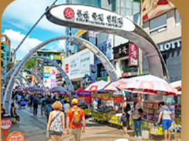
ตลาดนัมโพดง