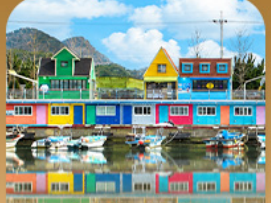
ท่าเรือจังกึม