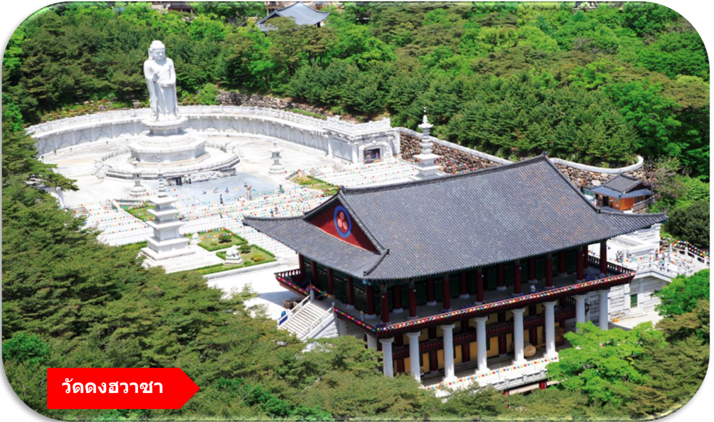
วัดดงฮวาซา