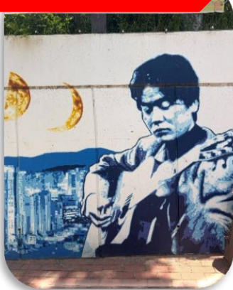
ถนนคิมควังชอก

นำท่านเที่ยวชม ถนนคิมควังชอก เป็นถนนสายเล็ก ๆ สุดอบอุ่นในเมืองแทกู ที่สร้างขึ้นเพื่อระลึกถึง คิมควังชอก นักร้องโฟล์กในตำนานของเกาหลีใต้ ผู้เกิดที่แทกูและเป็นศิลปินที่คนเกาหลียังคงรักมากจนถึงทุกวันนี้ เดิมทีบริเวณนี้เป็นกำแพงเก่าใต้ทางรถไฟ แต่ภายหลังถูกพัฒนาให้กลายเป็น "ถนนแห่งเสียงเพลงและความทรงจำ" ตลอดทางจะเต็มไปด้วยภาพวาดกราฟฟิตี้ รูปปั้นของคิมควังชอก งานศิลปะและมุมถ่ายรูปแนววินเทจ เส้นห์ของถนนนี้ไม่ใช่ความอลังการ แต่เป็นความรู้สึก "อบอุ่นและมีเรื่องราว" คาเฟ่ ร้านดนตรี และบรรยากาศย้อนยุค