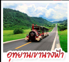
อุทยานเขาแดงฟ้า