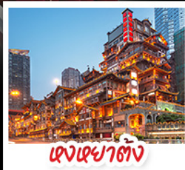
แดงหยาดัง