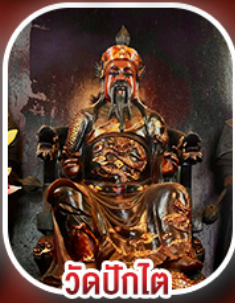
วัดปิกโต