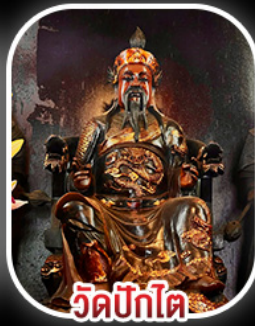
วัดปิกไค