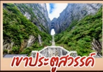
เขาประตูสวรรค์