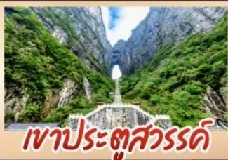
เขาประตูลั่วหวู่