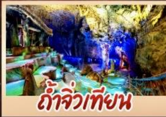
ถ้ำจิวเทียน