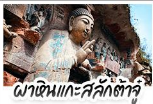
ผาหินแกะสลักต้าจู่