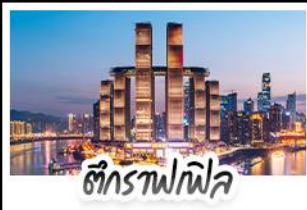
ตึกรางฟิว