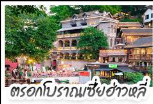
ตรอกโบราณเซี่ยฮ่าวหลี่