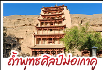
กำแพงศิลปะมอเกาคุ

มินิพระราชวัง - สระน้ำงพระจันทร์ ทะเลสาบเกลือฉางซ่า - กำแพงศิลปะมอเกาคุ หุบเขาสายรุ้งจางเย่ - ทะเลสาบชิงไห่