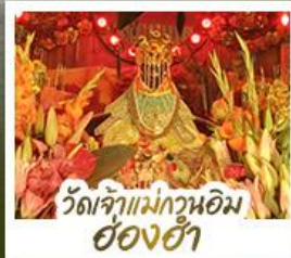
วัดเจ้าแม่กวนอิมอ้งอ้า