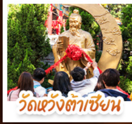
วัดเข่งต้าเซียน