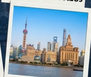
เข็คินที่เดอะบันด์