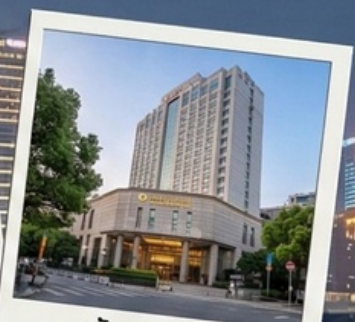
พักรู 4 ดาว City Hotel shanghai 3 คืน

Special Option : ทั่ว Disneyland + รถรับ-ส่ง เริ่มต้นที่ 3,900 บาท/ท่าน