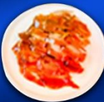
เสี่ยวหลงเปา+เปิดปักกิ่ง+สุกิมองโกล